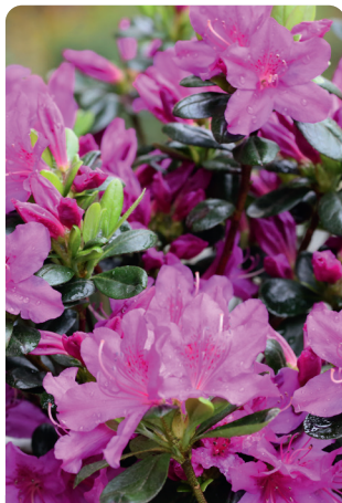
Lady Dark® -EU-S-